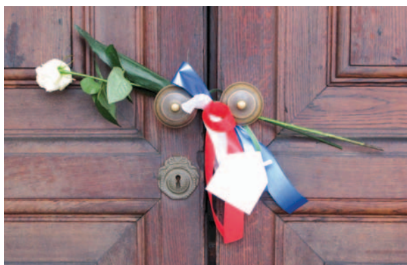
Un omaggio alle vittime di Parigi trovato all'ingresso del Municipio la mattina seguente agli attentati. All'interno del biglietto la scritta "Terroristi non vinceranno. Siamo tutti francesi!"